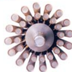
Vistazo del final del eje tipo tubo del Supercookor.